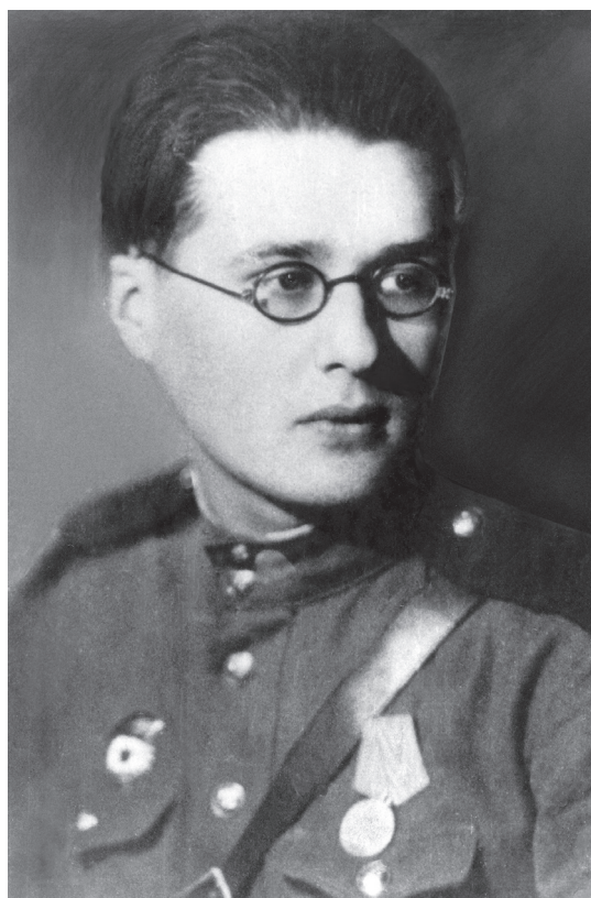
Во время отпуска, Москва, 1944.

Весной 1945 г. 4-я танковая армия была возвращена на рубеж р. Нейсе, откуда 16 апреля 1945 г. начала наступление на Берлин. 24 апреля между городами Потсдамом и Бранденбургом части 6-го мехкорпуса встретились с войсками 1-го Белорусского фронта, завершив окружение германской столицы и участвуя во взятии обоих этих го-