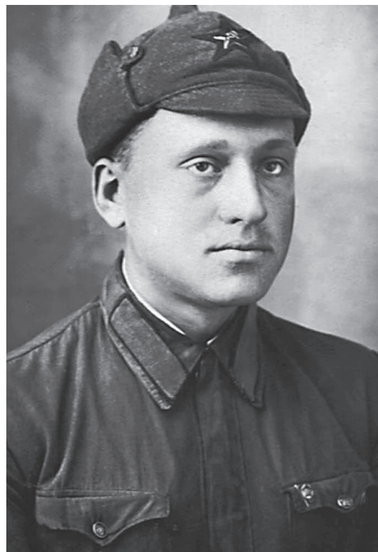
Весна 1940 г. (г. Котовск, Молдавия)

Разведка в артиллерии – это не походы в тылы противника, а наблюдения на батареях